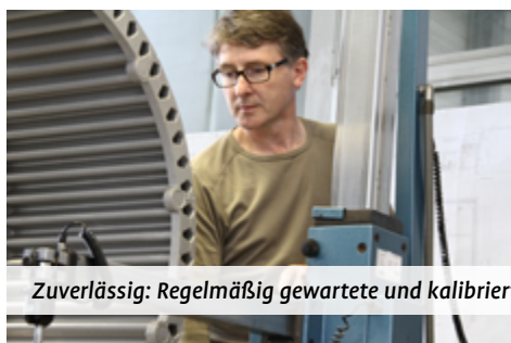
Zuverlässig: Regelmäßig gewartete und kalibrierte Messmaschinen.