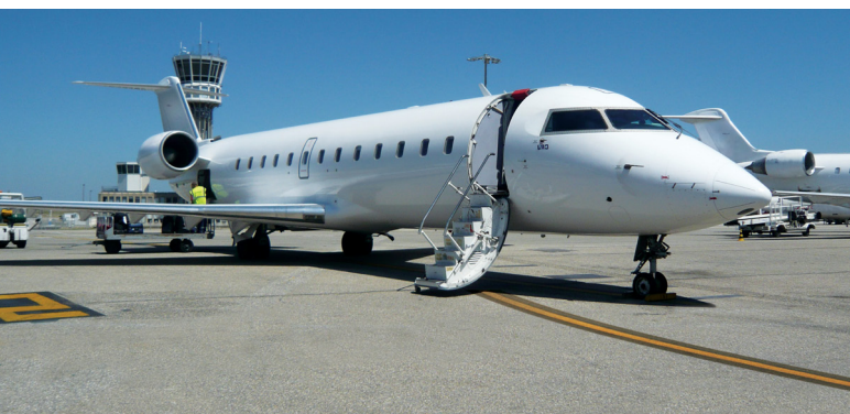
Bombardier ist Spezialist für Geschäfts-, Verkehrs- und Amphibienflugzeuge.

Applaus der Passagiere bis hin zu ernsthaften Beschädigungen des Flugzeugs. Nach jeder „Harten Landung“ muss die Maschine daher vor ihrem nächsten Flug auf strukturelle Schäden untersucht werden.