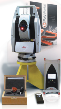
Der Leica Absolute Tracker AT 401, Corner Cube Reflector und PolyWorks/Inspector™.

die Suche nach einer Lösung zur drei dimensional Vermessung gemacht haben. Wir brauchten ein System, das weder unseren Input, noch Form und Ergebnisse unseres Messberichts beeinflusst. Nachdem ich die 3D-Hardware ausgesucht hatte, haben mir die Vermessungsspezialisten aus unserer Werkzeugabteilung PolyWorks empfohlen!“ Der Focus bei der Auswahl einer neuen Technik der CRJ Ground Service Equipment